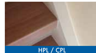
HPL / CPL

Wij werken met verschillende soorten materialen, zoals eikenhout, pvc en HPL/CPL, om je trap weer veilig, mooi en slijtvast te maken. Naast ledverlichting voor de trap hebben we ook bijpassend laminaat en trapeleuningen in rvs of (blauw)staal.